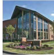
Centro de Esperanza Lindner (Lindner Center of HOPE, LCOH) de Cincinnati Children's 4075 Old Western Row Road Mason, OH 45040

561/Seymour Ave. Manténgase a la derecha en la bifurcación, siga los carteles para Ohio 4/Paddock Rd y confluya con OH-4 N/Paddock Rd. Gire a la izquierda para tomar E North Bend Rd y luego gire levemente hacia la izquierda para tomar W North Bend Rd durante aproximadamente 4 millas. Gire a la izquierda para tomar Hamilton Ave. durante aproximadamente 0.8 millas, la entrada para vehículos estará a su izquierda.