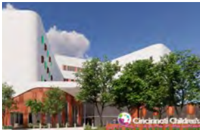
Cincinnati Children's Campus College Hill (Área P) 5642 Hamilton Avenue Cincinnati, OH 45224

Por razones de seguridad, se debe transportar a su hijo(a) en ambulancia de la sala de emergencias a la unidad de salud mental para pacientes ingresados. El padre/la madre/tutor lo(a) acompañará o se encontrará con el(la) paciente en el área donde sean admitidos. Los padres/tutores completarán el proceso de admisión y firmarán los consentimientos en el área donde su hijo(a) será admitido(a) para internación en el hospital. Se solicitará que los padres lo(a) sigan en su automóvil hasta el campus en que su hijo(a) sea admitido(a).